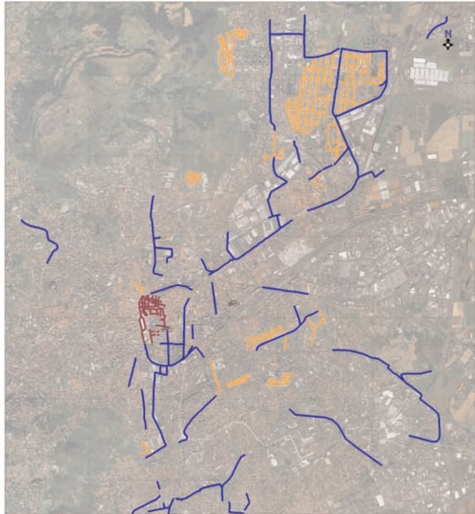
L'espace dédié aux modes doux sur la commune de Clermont-Ferrand en 2008.

La figure n°2 montre que la continuité du réseau cyclable s'est nettement améliorée avec la réalisation des itinéraires supplémentaires notamment les 9 Km le long de la ligne A de tramway. A proximité de la ligne A de tramway, certains quartiers ont bénéficié de réels aménagements qualitatifs pour les transformer en zone 30, comme la Plaine qui est de loin la plus vaste.